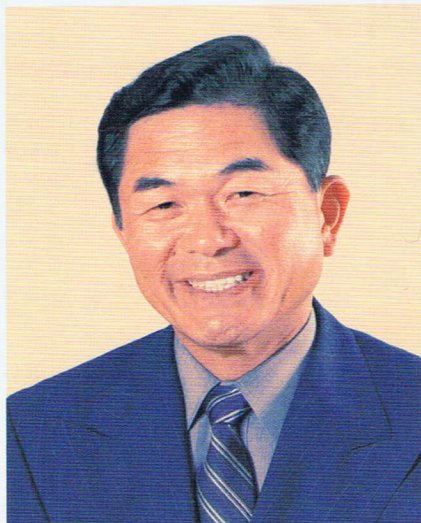
よしむら敏男 福岡県議会議員